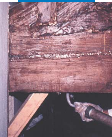
Iniezione di Mapewood Gel 120