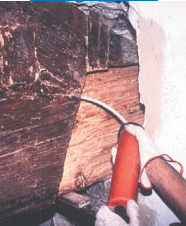
Iniezione di Mapewood Gel 120