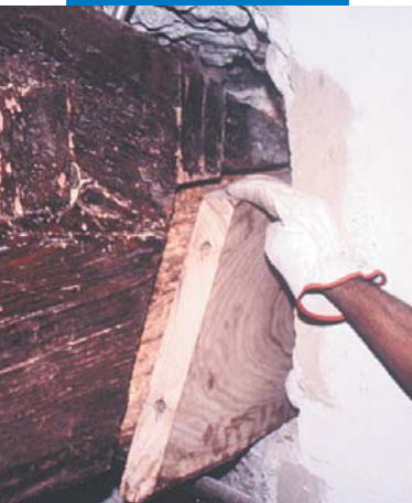
Riprifilatura della trave

Cercare di evitare, durante le operazioni di taglio e foratura, la formazione di scheggiature e bruciature superficiali o la creazione di zone con fibratura strappata o schiacciata.